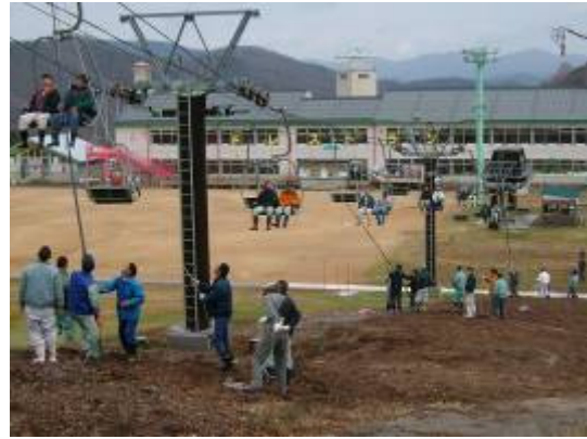
救助訓練（平成20年2月7日）