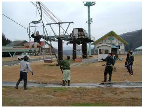
救助訓練（平成21年2月6日）