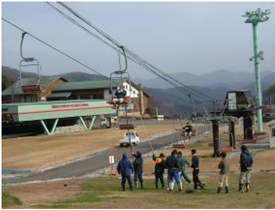
救助訓練（平成21年2月5日）